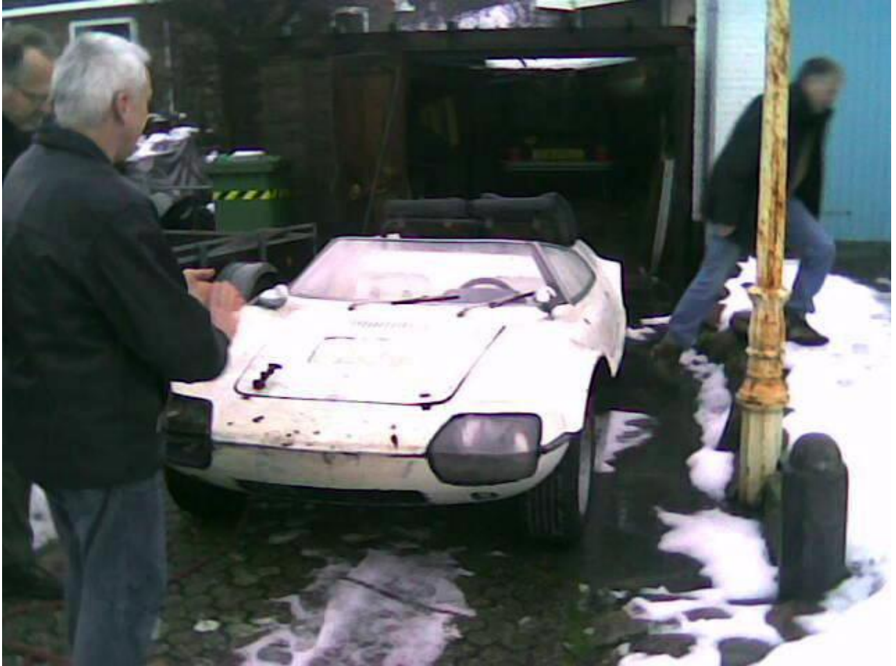
Januar 2010 - nach 30 Jahren in einer holländischen Scheune ist der OSI Alpine CRV Prototyp von 1966 wieder aufgetaucht.

Anfang der 70er Jahre erwarb ein Marbon-Chemical Mitarbeiter den CRV und baute ihn sich für den Renneinsatz um. Er tauschte den Motor, zog dicke Räder auf - wofür er die Radausschnitte verbreitern musste - verschraubte einen Überrollbügel sowie Sicherheitsgurte und lackierte den OSI CRV in weiß. Schon nach wenigen Jahren verkaufte er den OSI weiter und seit Ende der 70er Jahre parkte er in einer holländischen Scheune nahe der Nordsee wo er bis vor ein paar Wochen praktisch vergessen herumstand. Erst als der Bauer Platz in seiner Scheune braucht ruft er den Besitzer an was denn nun mit dem "Schrotthaufen" zu tun sei. Letztlich entschließt er sich den OSI CRV zu verkaufen und ich kann ihn Januar 2010 abholen.