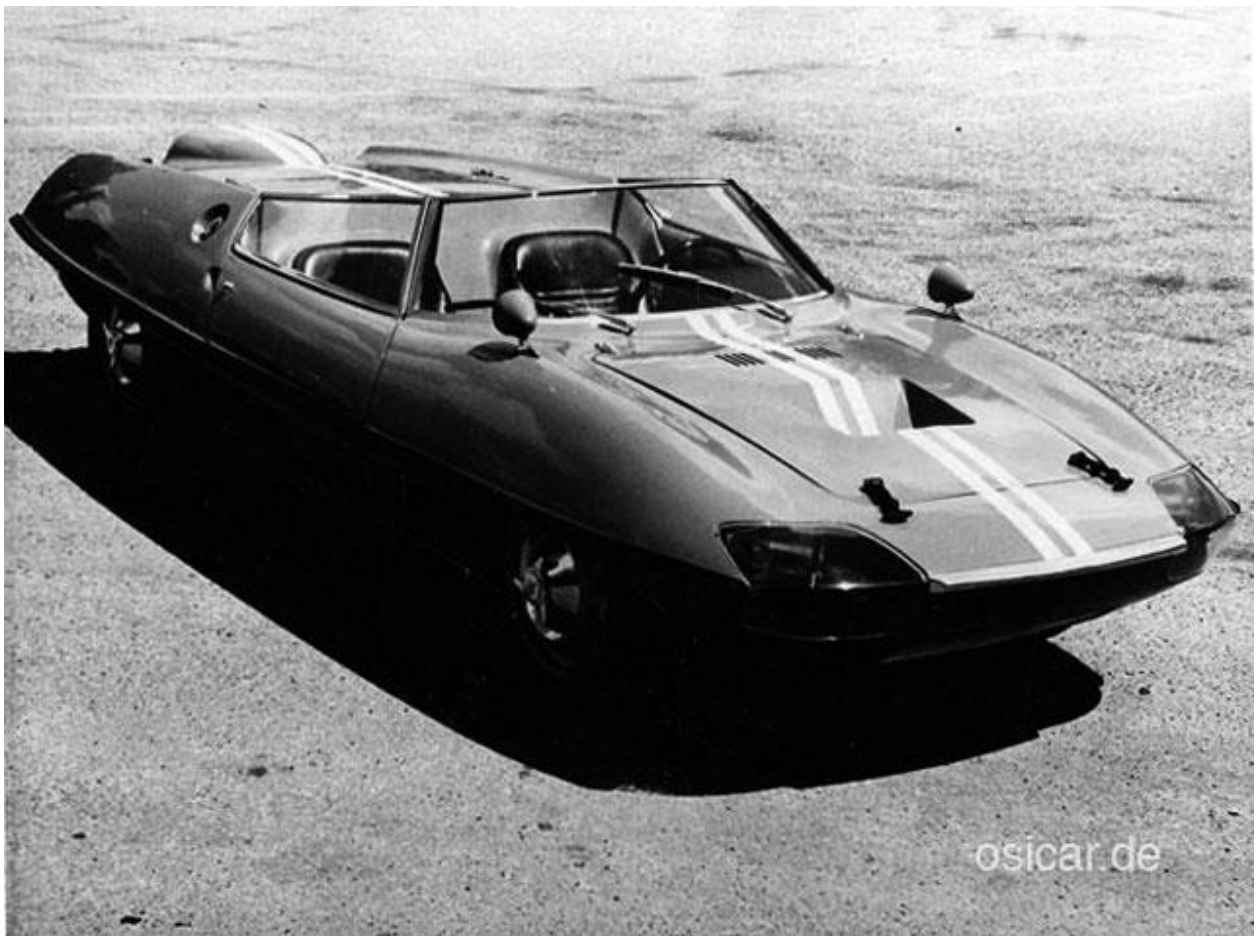
Pressefoto des OSI Alpine CRV