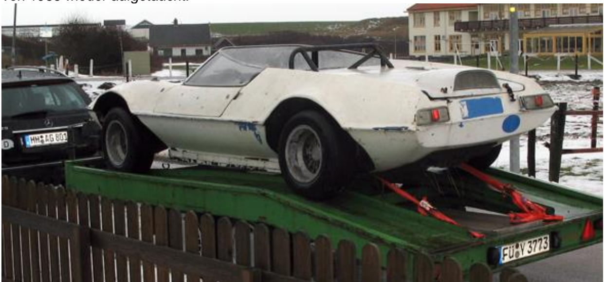
Gleich hinterm Deich - OSI Alpine CRV schon fertig verladen und bereit zum Abtransport.

Es gibt schon zu anderen OSI Fahrzeugen wenige Unterlagen aber zu diesem CRV gibt es praktisch gar nichts! Wer mir mit Zeitungsausschnitten, Messfotos oder was auch immer zu diesem Fahrzeug weiterhelfen kann, ich bin für jede Information dankbar!