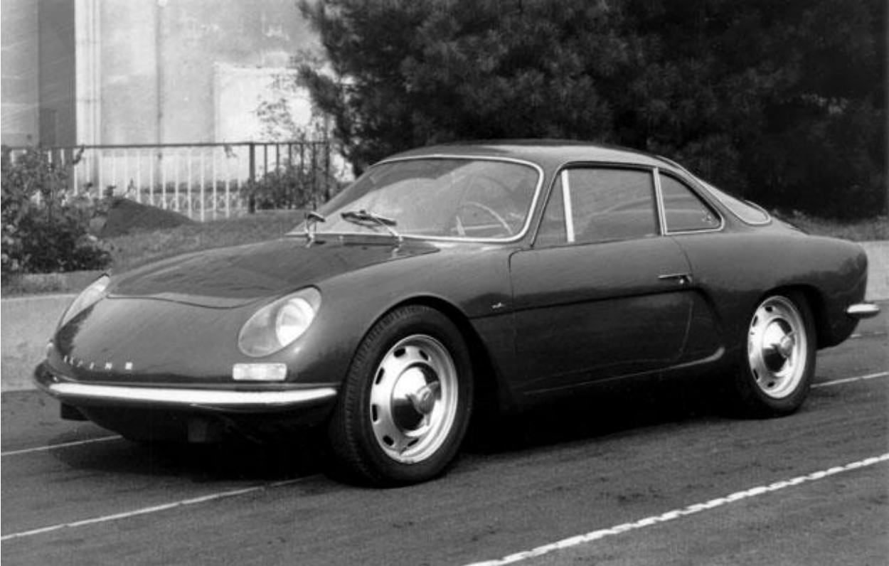
OSI Prototypen: OSI Alpine Berlinetta, Design: Giovanni Michelotti