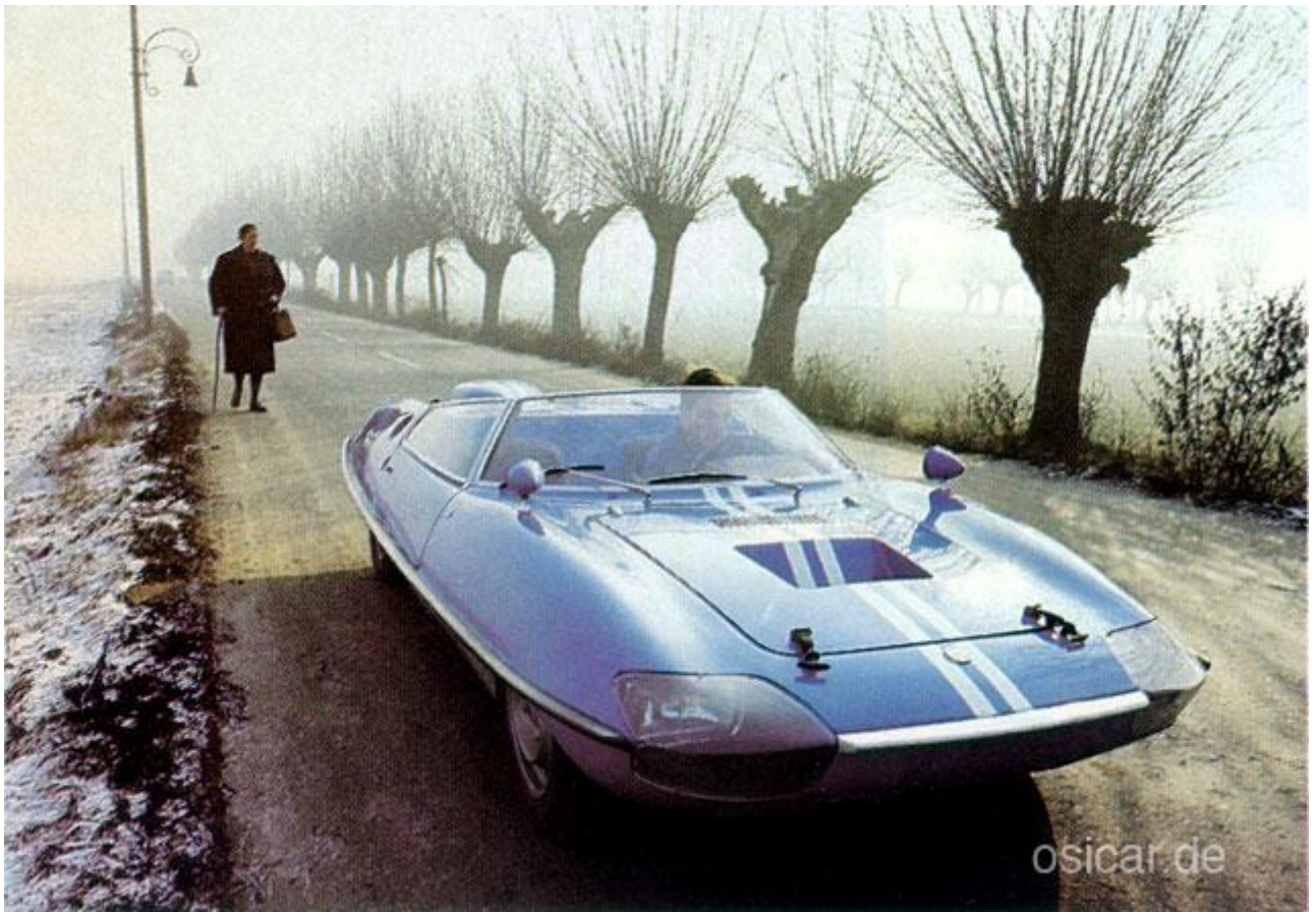
Der OSI Alpine CRV, Anfang 1967 auf einer Landstraße nahe Turin.

Der größte Erfolg dieser Werbetour dürfte am Ende der Verkauf des Verfahrens an Citroen gewesen sein, der als erster Hersteller ein ABS Fahrzeug in Serie produziert - den Citroen Mehari.